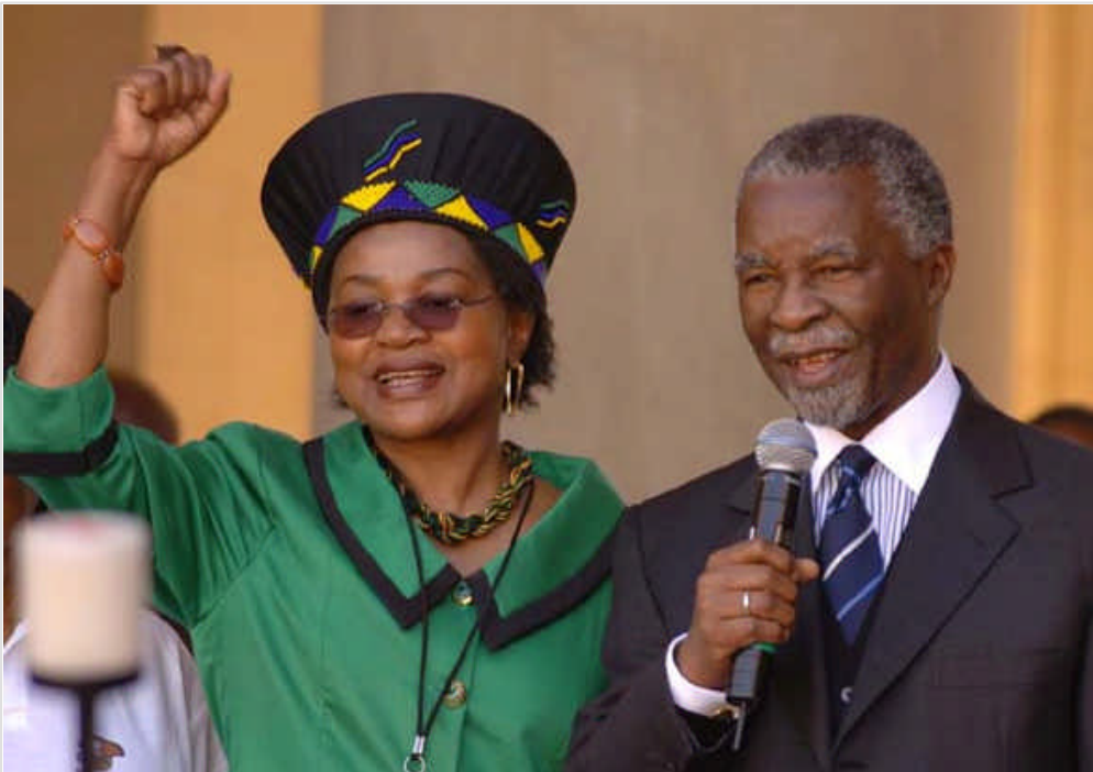
Le Président Thabo Mbeki et la Présidente de l'Assemblée Nationale, Mme Baleka Mbete, célèbrent la Journée Nationale de la Femme.

Afrique du Sud, construire une nation gagnante dans une Afrique meilleure et un monde meilleur