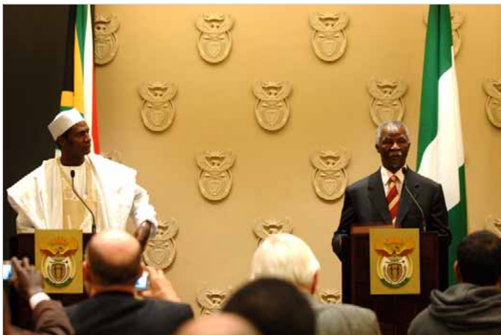
Le Président Mbeki et son homologue du Nigéria, Umari Yar 'adua, en visite officielle en Afrique du Sud, s'adressent à la presse, au Cap, le 3 juin 2008.

Afrique du Sud, construire une nation gagnante dans une Afrique meilleure et un monde meilleur