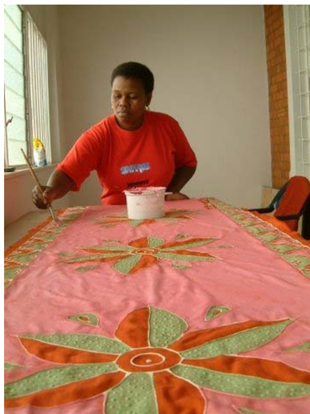
L'initiative de « Pakhamani Textiles » permet à de nombreuses femmes du Kwazulu-Natal d'avoir un travail et de perpétuer un art exceptionnel.

AP Gem Melville , Chemin de Los Quintanes, 66400 REYNES - gem.melville@gmail.com Tél . 04 68 87 25 95