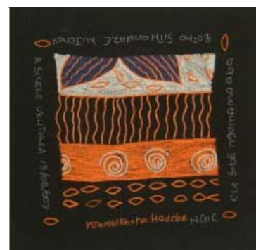
Montées sur châssis, ces peintures forment de véritables tableaux (photos 1 & 3). Papier fabriqué à base de feuilles de bananes avec des fragments de peinture Pakhamani originale faite à la main (photo 2)