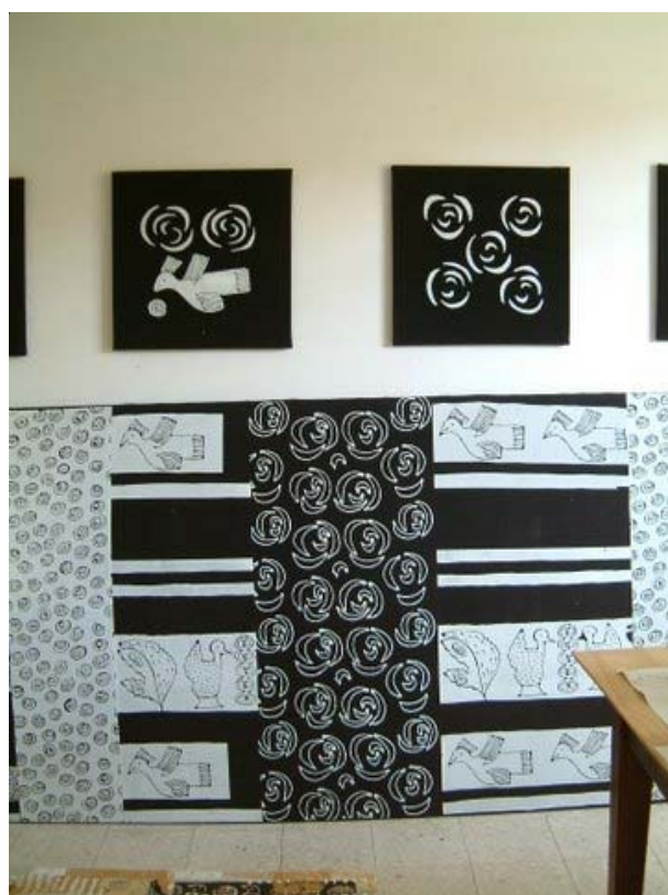
Montage d'une exposition de la série « Noir et Blanc »