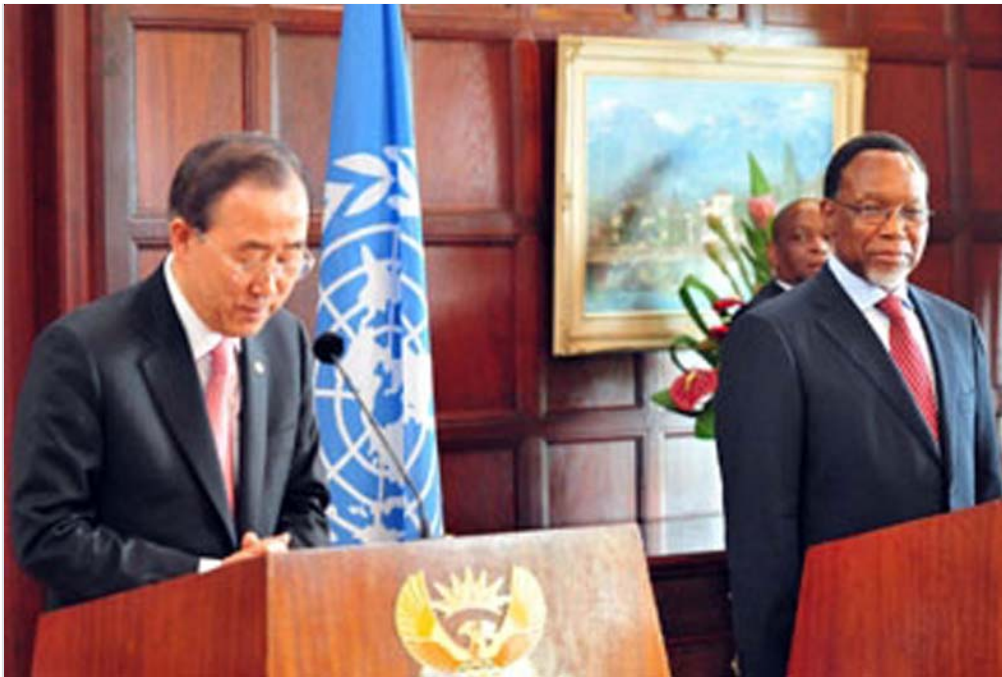
Le secrétaire général de l'ONU, Monsieur Ban ki-Moon, et le Président Motlanthe.

Afrique du Sud, construire une nation gagnante dans une Afrique meilleure et un monde meilleur