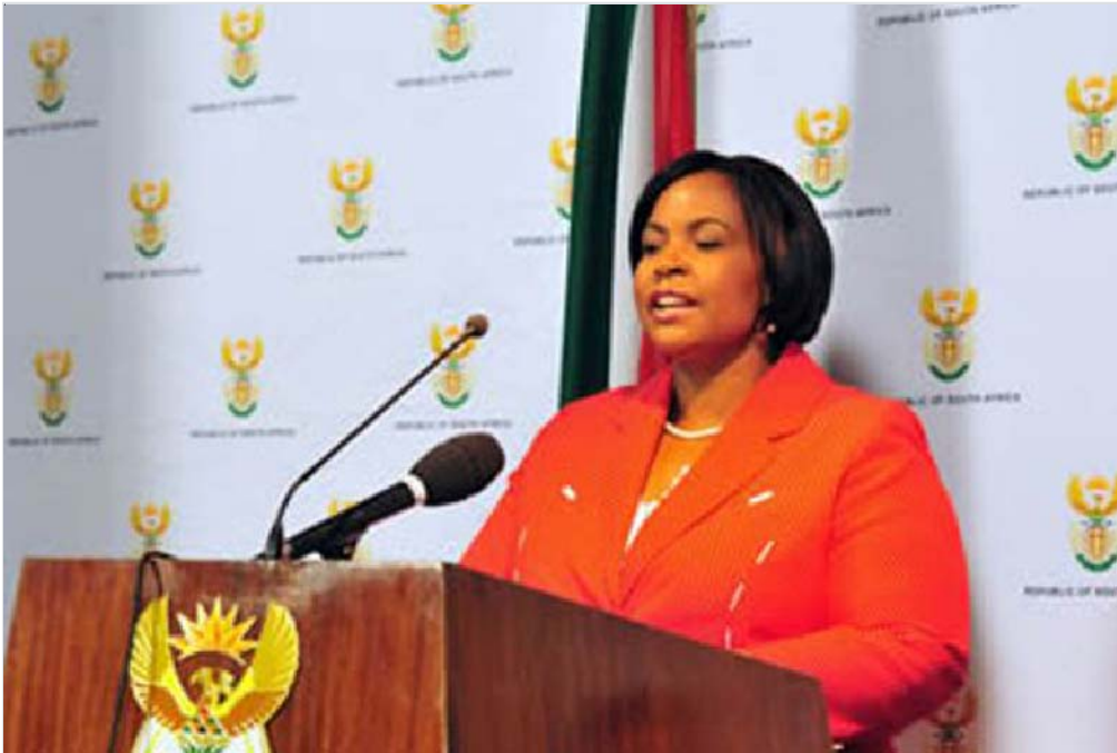
Le nouveau ministre sud-africain des Relations et de la Coopération Internationales, Madame Maite Nkoana-Mashabane

Afrique du Sud, construire une nation gagnante dans une Afrique meilleure et un monde meilleur