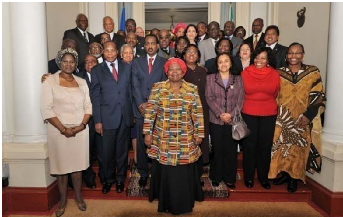
A l'occasion de la visite à Paris de Madame Nkosazana Dlamini Zuma, l'Ambassadeur de la République d'Afrique du Sud en France, S.E. Madame Dolana Msimang, a reçu en sa résidence, les représentants des pays africains à Paris