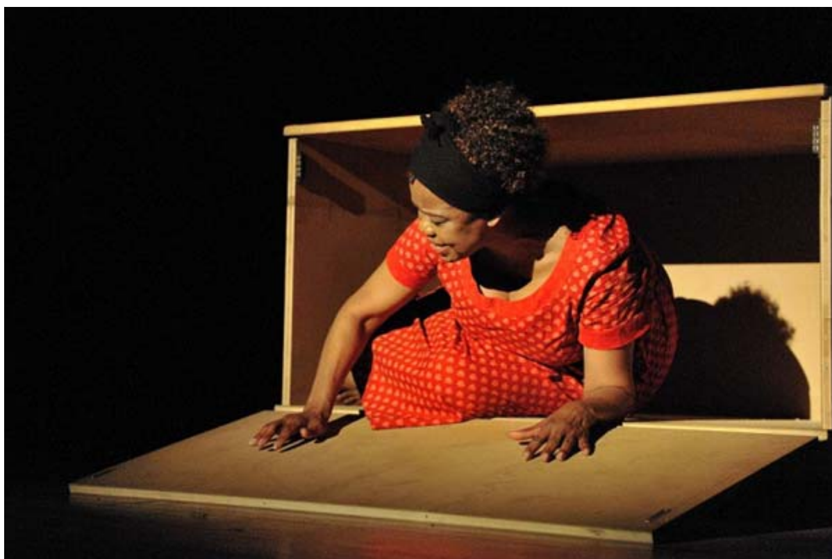
Mme Thembie Mtshali, actrice sud-africaine de renommée internationale interprète la pièce de théâtre « Woman in Waiting »

En reconnaissance du rôle important que l'OPF a joué et qu'elle continue d'assumer dans la défense de l'égalité des sexes et dans la reconstruction et le développement du continent, l'Afrique du Sud et la Tanzanie ont ainsi estimé qu'il convenait de rendre hommage aux accomplissements de l'OPF en s'associant avec l'UNESCO pour fêter l'anniversaire de sa création.