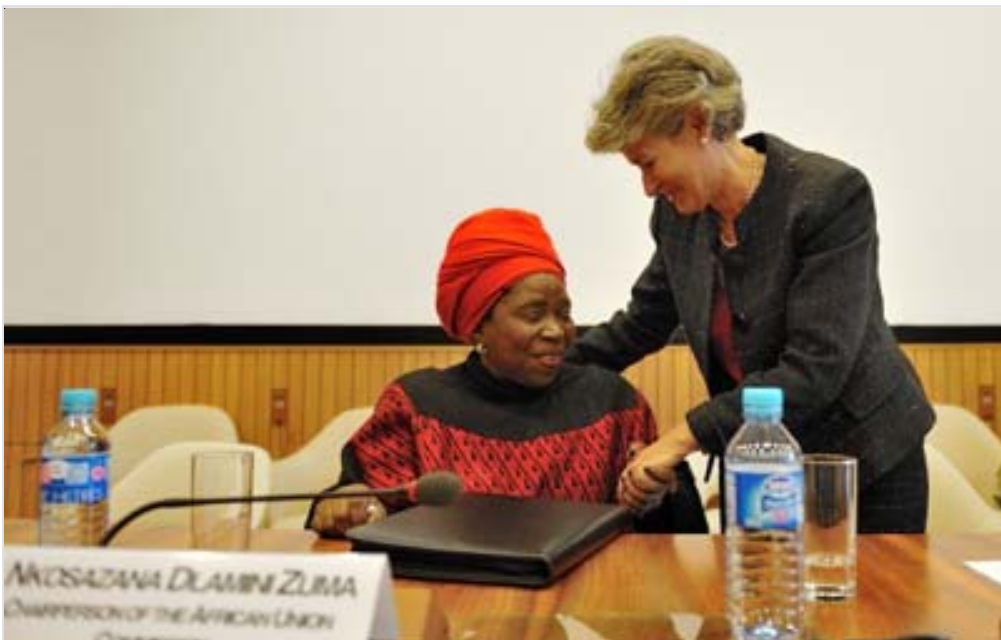
Madame Irina Bokowa, Directeur Général de l'UNESCO, salue la Présidente de la Commission de l'Union Africaine, Madame Nkosazana Dlamini Zuma, à l'occasion des célébrations du cinquantième anniversaire de l'Organisation panafricaine des Femmes.

Afrique du Sud, construire une nation gagnante dans une Afrique meilleure et un monde meilleur