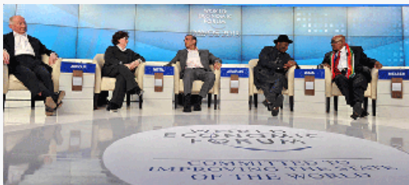
Le Président Jacob Zuma au Forum économique annuel à Davos