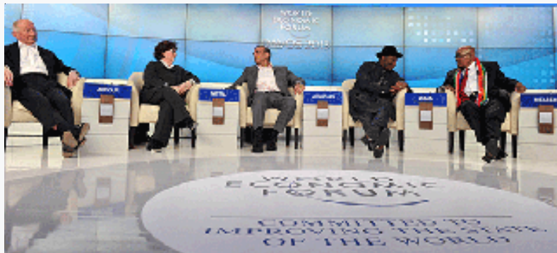
Le Président Jacob Zuma au Forum économique annuel à Davos

Le Président Jacob Zuma, qui était à Davos du 22 au 26 janvier dans le cadre du Forum économique annuel, a indiqué qu'il allait profiter de cette rencontre pour inviter les investisseurs à participer à des projets d'infrastructure dans le pays et en Afrique en générale. « Cela sera bénéfique pour la croissance économique du continent à long terme », a déclaré la veille de la rencontre le porte-parole de la présidence, M. Mac Maharaj. « Le président Zuma veut également utiliser la plate-forme du forum de Davos pour promouvoir le Plan National de développement (PDN), qui dessine la vision de la nation que l'Afrique du Sud s'efforce à devenir d'ici 2030 », a déclaré M. Maharaj. Lors du forum, M. Zuma a invité les entreprises internationales à investir dans les projets d'infrastructure de plusieurs milliards de rands qui doivent changer le paysage social et économique du pays, selon M. Maharaj. Le chef de l'Etat sud-africain, qui défend le corridor de développement de l'Union africaine, qui relie Durban à Dar-es-Salaam, a également profité de sa présence en Suisse pour promouvoir ce projet.