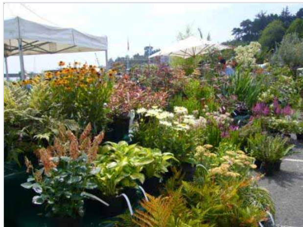
Une occasion unique de découvrir des espèces venues de très loin.