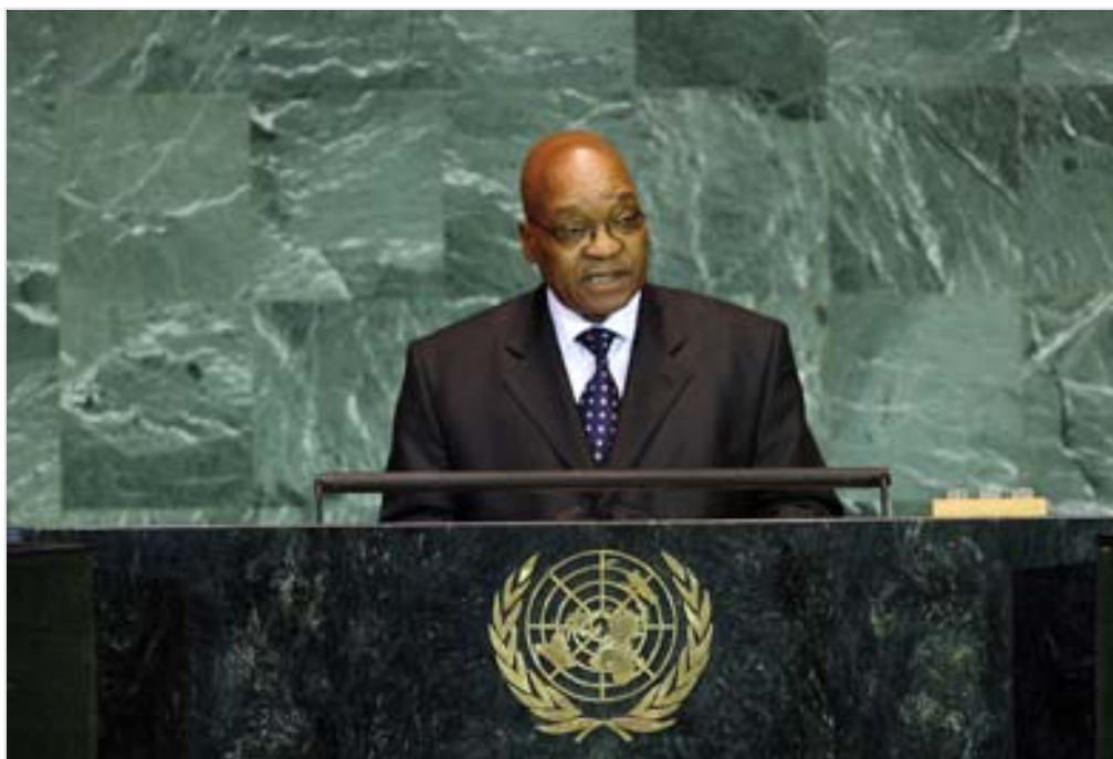
New York le 23 septembre 2009. Le Président Jacob Zuma prononce son premier discours devant l'Assemblée Générale des Nations unies

Afrique du Sud, construire une nation gagnante dans une Afrique meilleure et un monde meilleur