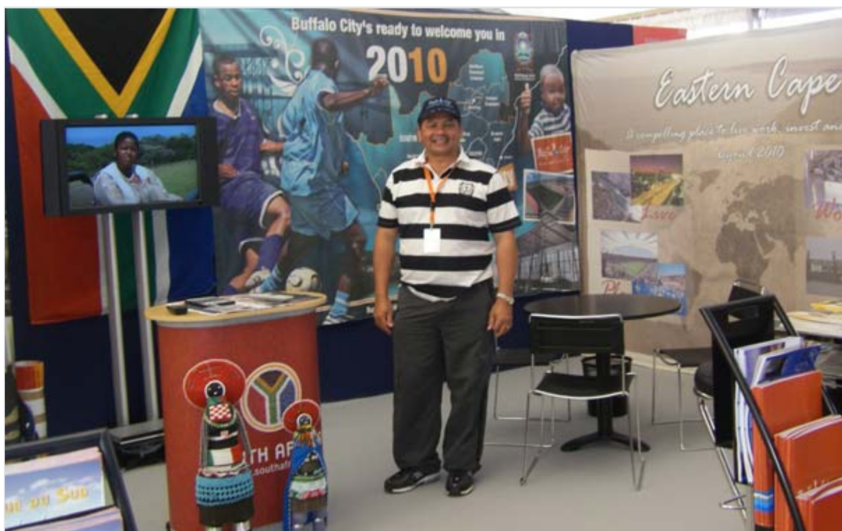
Le stand sud-africain