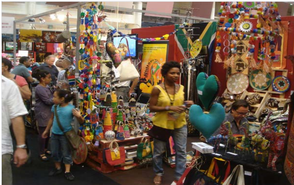
L'artisanat sud-africain a eu un grand succès