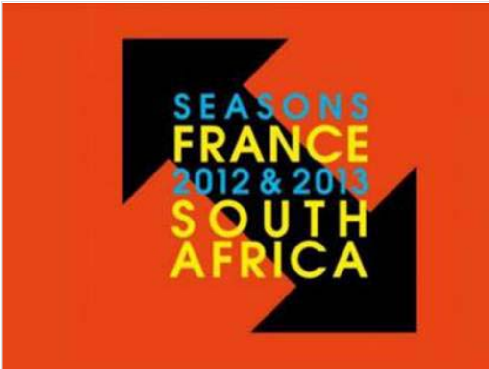
Logo des Saisons Croisées 2012-2013

Afrique du Sud, construire une nation gagnante dans une Afrique meilleure et un monde meilleur